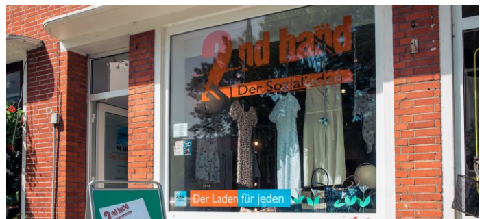
Der Sozialladen "2nd hand" an seinem heutigen Standort in der Hermann-Allmers-Straße 1b.